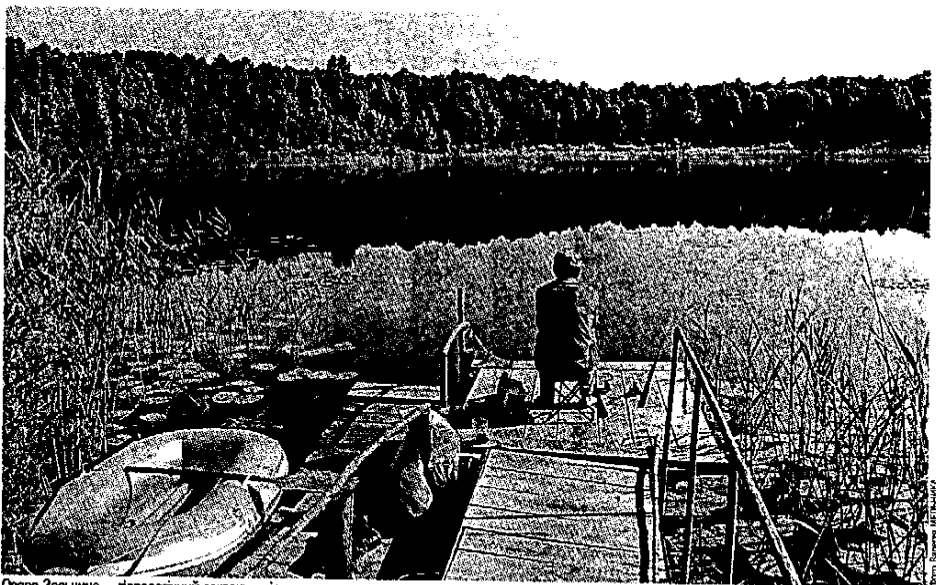
Озеро Зосьчине — ґдрологічний заказник місцевого значення

нього остаточним політичним кроком. А послухати наших... То там, то тут йде нагнітання негативу з боку деяких владних органів. І досить часто за цим — бажання окремих посадовців чи депутатів «приватизувати» найкращі і плодючі землі. А людям втовкмачують, що й створення нових національних парків — це бідність! Хоча це зовсім не так, що засвічує іншоземні досвід.